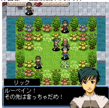
連続殺人犯「ゲイツ」を追う主人公リック。