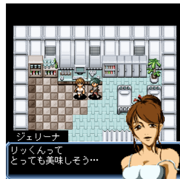
一癖も二癖もある魅力的なキャラクター達。事件解決に協力してもらおう。

サイト名 : RPG大集合! 情報料 : 月額315円(税込) サイトメニュー : i Menu メニューリスト ゲーム ミニゲーム 著作権表記 : ©OPENDOOR