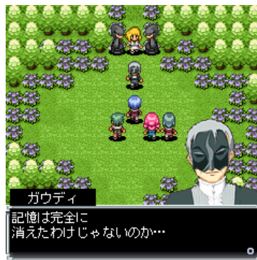
ルトの記憶を知る人物「ガウディ」影で蠢く陰謀の正体とは!?