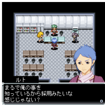
害虫駆除会社で働くはずだった主人公ルトは、特殊警察「リプル」の一員となり各地を回ること...