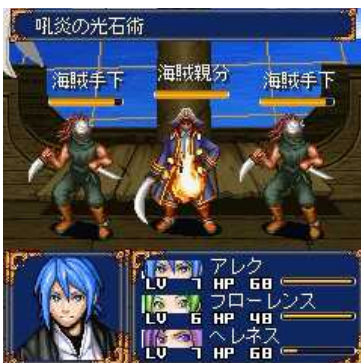
主人公「アレク」。装備を強化して海を支配する海賊を撃退しよう!!