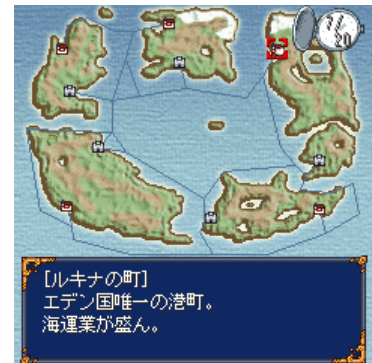
各地へ向うために必要となる海図。航海に先に待ち受けるものとは...

サイト名 : RPG大集合! 情報料 : 月額315円(税込) サイトメニュー : i Menu メニューリスト ゲーム ミニゲーム 著作権表記 : OPENDOOR