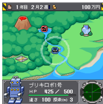
マップ画面。探索レーダー「ソナー」を使い、周囲に眠るお宝を探し出そう。