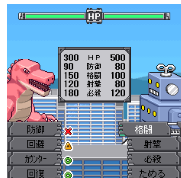
戦闘画面。相手の行動を読み攻撃していこう!!

サイト名 : RPG大集合! PCサイト : http://daisyugou.opendoor.co.jp/pc/index.html 情報料 : 月額315円(税込) サイトメニュー : i Menu メニューリスト ゲーム ミニゲーム 著作権表記 : OPENDOOR