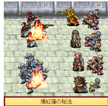
パワーアップした戦闘画面。兵士を携え強敵を撃ち砕き、特殊能力を身につけるのだ。

サイト名 : RPG 大集合! PC サイト : http://daisyugou.opendoor.co.jp/pc/index.html 情報料 : 月額315円(税込) サイトメニュー : i Menu メニューリスト ゲーム ミニゲーム 著作権表記 : OPENDOOR