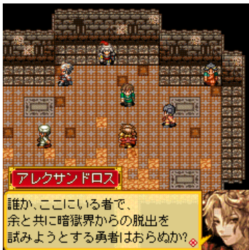
前作では日ノ本に攻め入ったディストピア軍の頭「アレクサンドロス」。