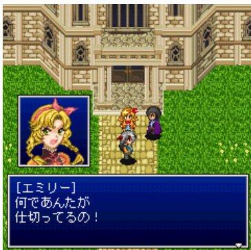
「クレスト・ウルヴ」の一角「エミリー」。気が強い性格が特徴。