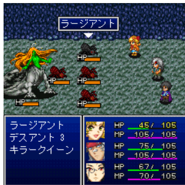
戦闘画面。攻撃技やスキルや駆使して、敵を倒そう!!