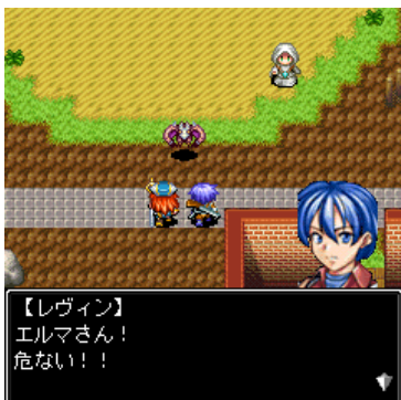
主人公「レヴィン」。世界を救う冒険へと繰り出し、勇者伝説の謎を解き明かしていく...