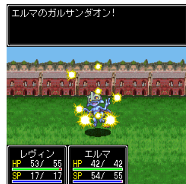
戦闘画面。スキルを使いこなし、人々の脅威となる魔物を退治していこう!!

サイト名 : RPG大集合! PCサイト : http://daisyugou.opendoor.co.jp/pc/index.html 情報料 : 月額315円(税込) サイトメニュー : i Menu メニューリスト ゲーム ミニゲーム 著作権表記 : OPENDOOR