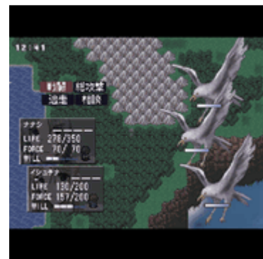
戦闘画面。強力な魔法で対抗しよう!!