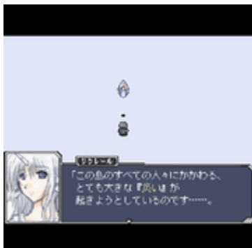
「あなた」は謎の女性「リクレール」によってこの世界に召喚されたのだ!!