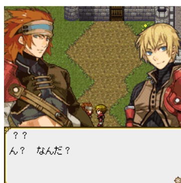
イベント画面。新米兵士「ブラガ」と出会い、共に戦う仲間となる。