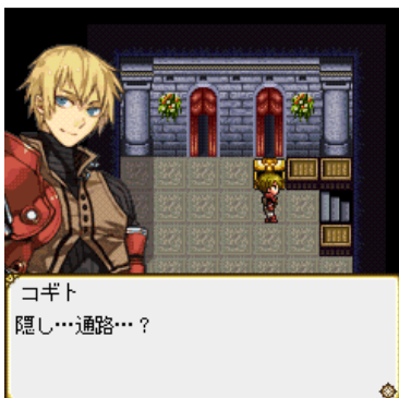
主人公「コギト」。城内で隠し通路を発見!! その先に待ち受けているものとは…!?