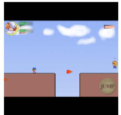
ボスの強力な攻撃にキミは耐えられるか!