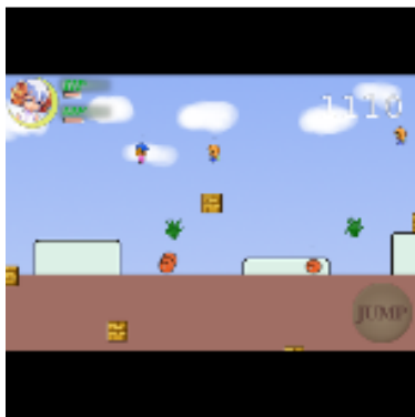
かわいいヒツジの女の子が飛んで跳ねて避けまくる!