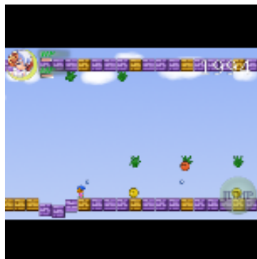
多種多様な攻撃手段で襲い掛かる敵達。上手く操作して攻略しよう!