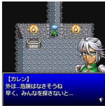
迷宮内には魔物の姿もちらほら。無事に合流し、脱出できるのだろうか…。