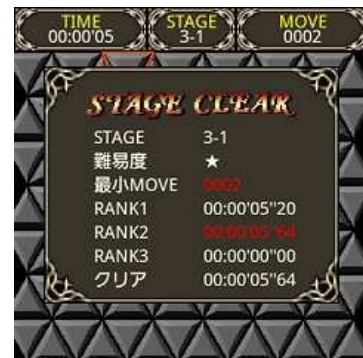
時間と手数はそれぞれの最高記録が記録されます。